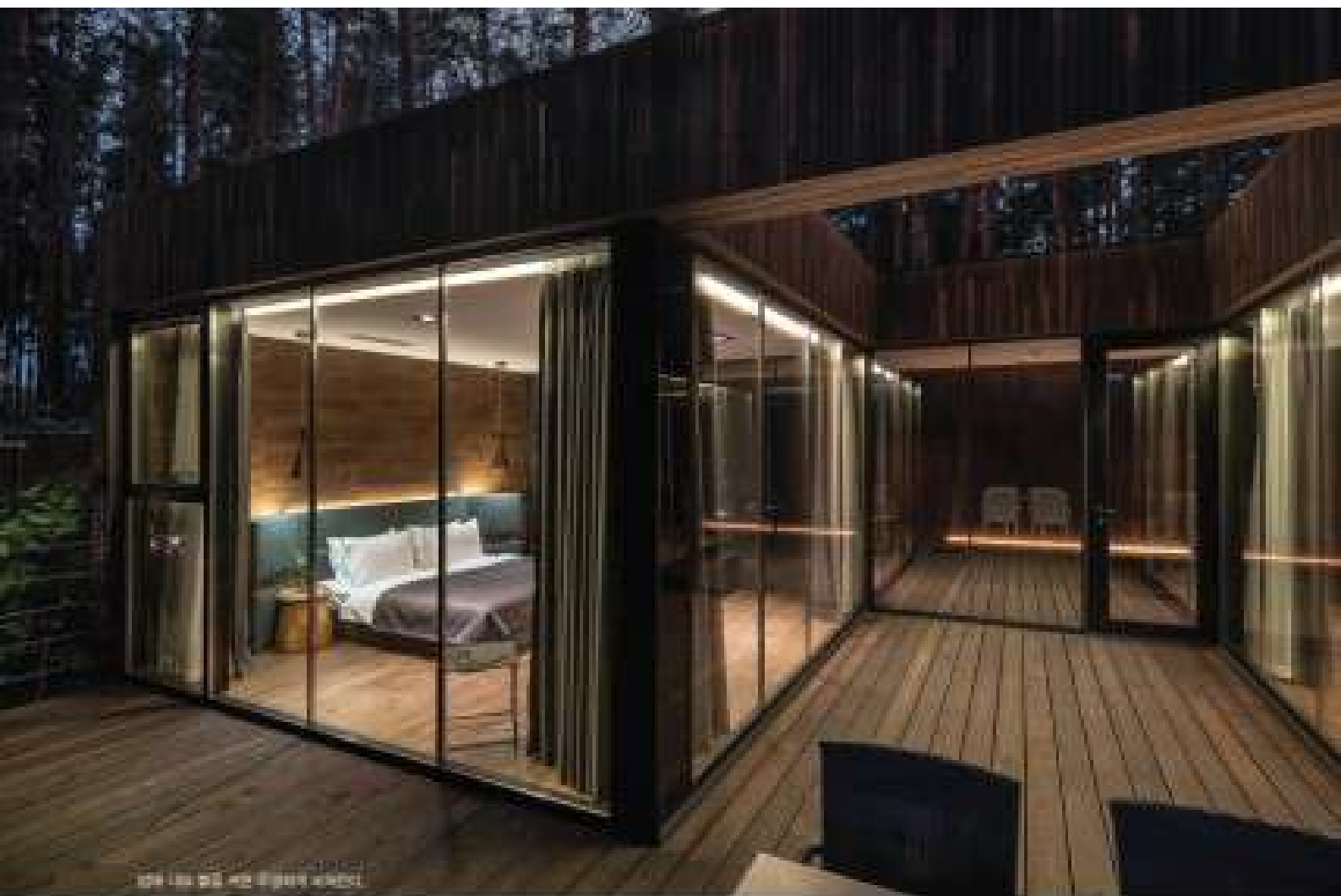
12월 14일 18:00 ~ 20:00까지 운영함

객실 내에 조나무 숲의 풍경을 들머 무릎 위에서 진정한 의미의 휴식을 제공하는 Verbody Relax Park가 최근 새로운 객실을 개장했다. 특수 처리된 유리로 외관을 꾸며 자연과 한층 가까워진 객실은 숲 향기, 새들의 지저귌, 시원한 바람에 오롯이 집중할 수 있는 공간을 선사한다. 객실은 편편 형태의 개방 공간으로 이루어지는데, 이 중 새로 신선했던 객실은 양에서 3m 높이의 맞장대 위에 대표관동란 모습으로 위치한다. 디자인 스튜디오 YOD design lab은 객실을 맞이대로 공간에 지평 주변 나무의 뿌리를 손잡사지키 않고, 원형만 방수 처리가 가능하도록 시도했다. 객실은 금속 프레임으로 벽체를 만들고 식민에 밤사 유리를 적용했다. 밤사 유리는 일반 유리 표면에 금속필름의 얇은 막을 얹어 태양광선의 반사율을 높인 유리로 있어 일조량 저를 최소화 시켜준다. 따라서 객실은 낮에 보면 주변 풍경에 자연스럽게 융합해 프라이빗한 공간으로 느껴지는 반면, 밤에 있는 밤에 내부의 풍운, 커튼 무절하게 요란해 아름다운 경관을 만든다. 아울러 내부에서는 유리가 자연 풍경을 아래없이 투명하게 비춰 자연 속에 꼭 잠겨 있던 것 같은 감각을 심는다. 이 밤사 유리는 심지어적으로도 이질감을 뿐 아니라 내부의 방갈 부위를 강조해 에너지 감성에도 유효적이다. ㄱ